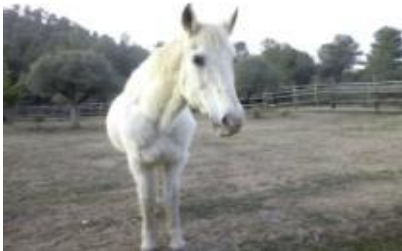
ELUR GADES, caballo 9 de enero