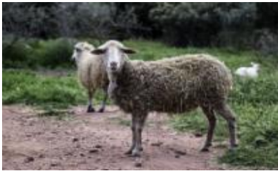
ANNA, oveja 22 de febrero