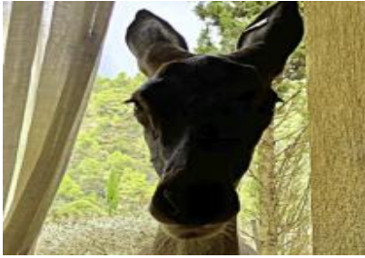
RUTH, cierva 20 de marzo