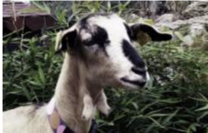
NINA-BEL, cabra 2 de noviembre