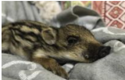
ZORTE, jabato 30 de octubre