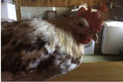
EZE, gallo 17 de marzo