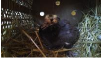
BRYAN MAY, pichón 16 de noviembre

Aquí os presentamos los rescates realizados durante 2018: