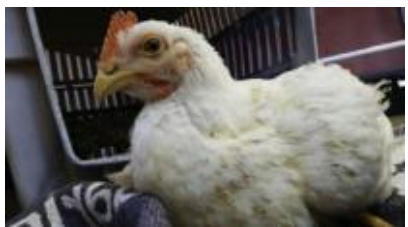
BLUE, broiler 18 de septiembre